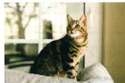
MIX(雑種)6歳 保険料 810円/月

血尿がみられ通院し、尿石症による膀胱炎の診断。その後、尿路閉塞を起こし緊急入院。入院し経過をみていたが改善がなく、手術を実施。